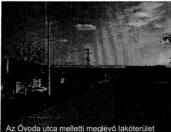
Az Óvoda utca melletti meglévő lakóterület

A területen elektromos légvezeték halad, ennek kiváltása folyamatban van.