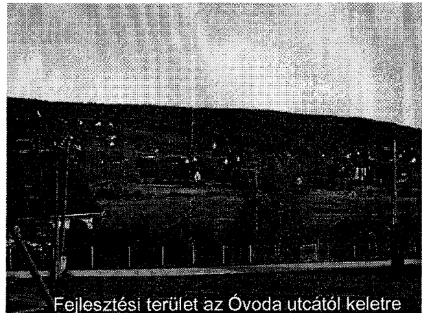
Fejlesztési terület az Óvoda utcától keletre